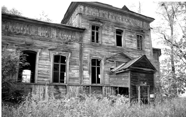
Церковь в Помаево – единственное уцелевшее здание села. Фото 2010 г.

– Зачем такие, не знай? – спросил Толян, он уже заскучал, стал позевывать и чесать левую руку. – Чё, пойдем? Нет тут ничего. Монеты тут тоже бесполезно искать. Лучше бы найти место бывшего магази-