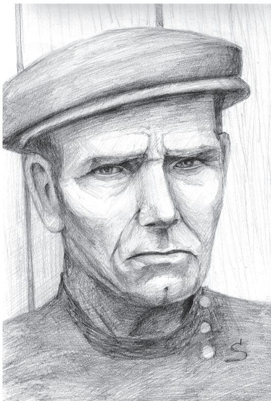
рисунок Татьяны Полововой

Повесть написана на основе подлинных текстов, зафиксированных от реальных рассказчиков. Некоторые имена персонажей и названия населенных пунктов изменены по этическим соображениям.