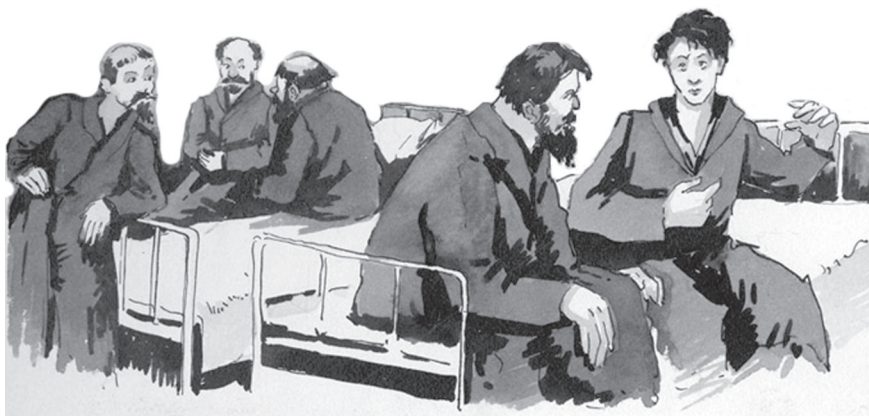
Рисунок Горбачева М.Г.